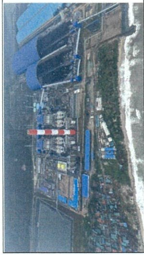
Nhà máy chính

Trong giai đoạn báo cáo, các hoạt động chính đã và đang được triển khai thực hiện bao gồm vận hành thương mại Tổ máy số 1, vận hành thử nghiệm Tổ máy số 2, và khắc phục các thiệt hại của nhà máy do cơn bão Số 10 (Bualoi) gây ra.