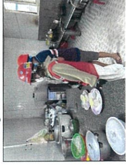
Kiểm tra vệ sinh an toàn thực phẩm các lần trại công nhân