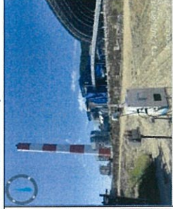
Quan trắc môi trường hàng quý