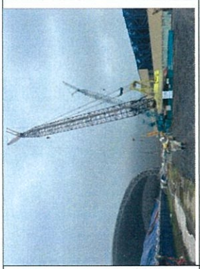
Khắc phục thiệt hại kho than