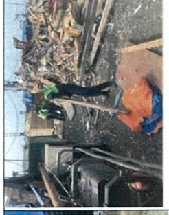
Thu gom và xử lý rác thải hàng ngày